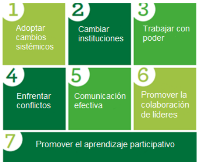
Figura 3. Siete Principios para la facilitación efectiva de plataformas de múltiples interesados.