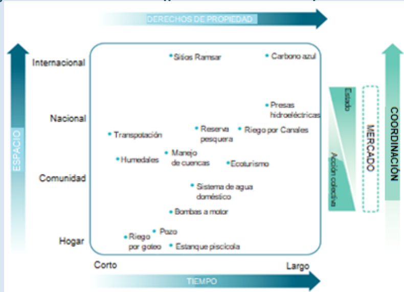
Figura 2. La relación entre la gobernanza de los RAD y los derechos de propiedad.

Mientras más larga sea la duración de un tipo específico de RAD, mayor la importancia de la seguridad de ocupación. La ubicación exacta en la figura de un tipo particular de RAD depende del tiempo requerido para que la inversión vea sus “frutos”. En general, prácticas generales o tecnológicas que rinden frutos por un período breve son mostradas a la izquierda y aquellos que requieren décadas y hasta generaciones antes de ver los frutos se muestran a la derecha. Mientras más grande el espacio, mayor será la necesidad de coordinación, sea por el estado, la acción colectiva o el mercado.