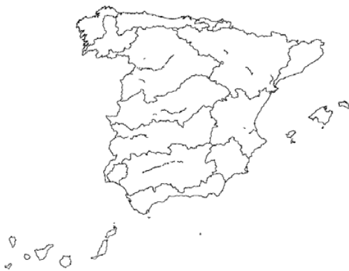
Tipo 17. Grandes ejes en ambiente mediterráneo