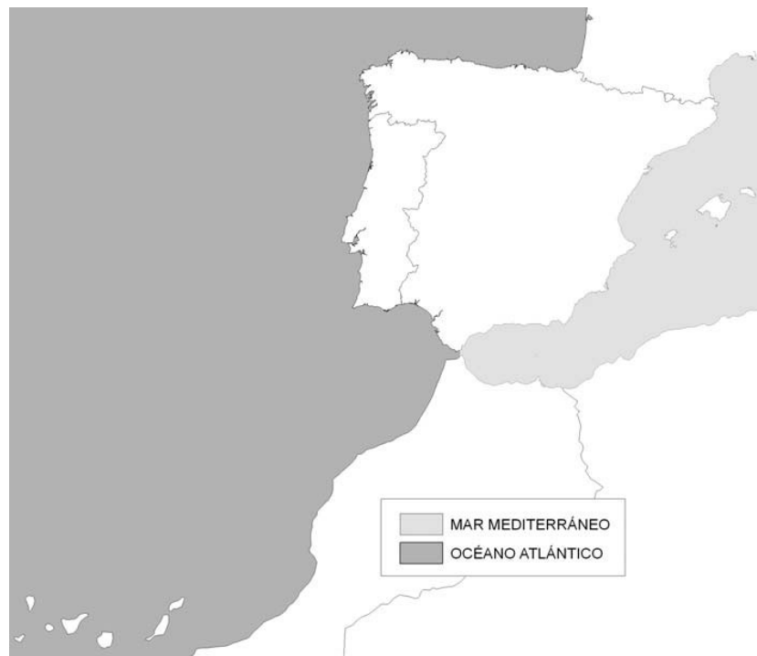
Figura 3. Regiones ecológicas de aguas de transición y costeras

Las regiones ecológicas de las aguas de transición y costeras serán el Océano Atlántico y el Mar Mediterráneo, como se muestra en la figura 3.