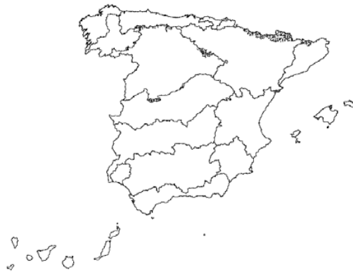
Tipo 27. Ríos de alta montaña