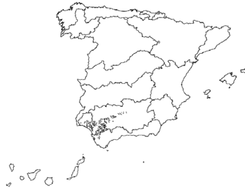
Tipo 2. Ríos de la depresión del Guadalquivir