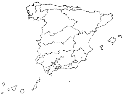
Tipo 7. Ríos mineralizados mediterráneos de baja altitud